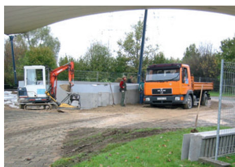
Arbeiten auf der Landesgartenschau in Paderborn